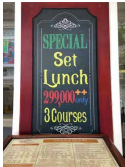
1 ランチはわずか 29.9 万ドン!

乗車する時のヘルメット着用が義務付けられた。そのため道路脇には、お祭りや縁日の屋台で並んでいるお面のように、ピカピカのヘルメットが壁に張り巡らされていた。という訳で、ベトナムは久しぶりである。