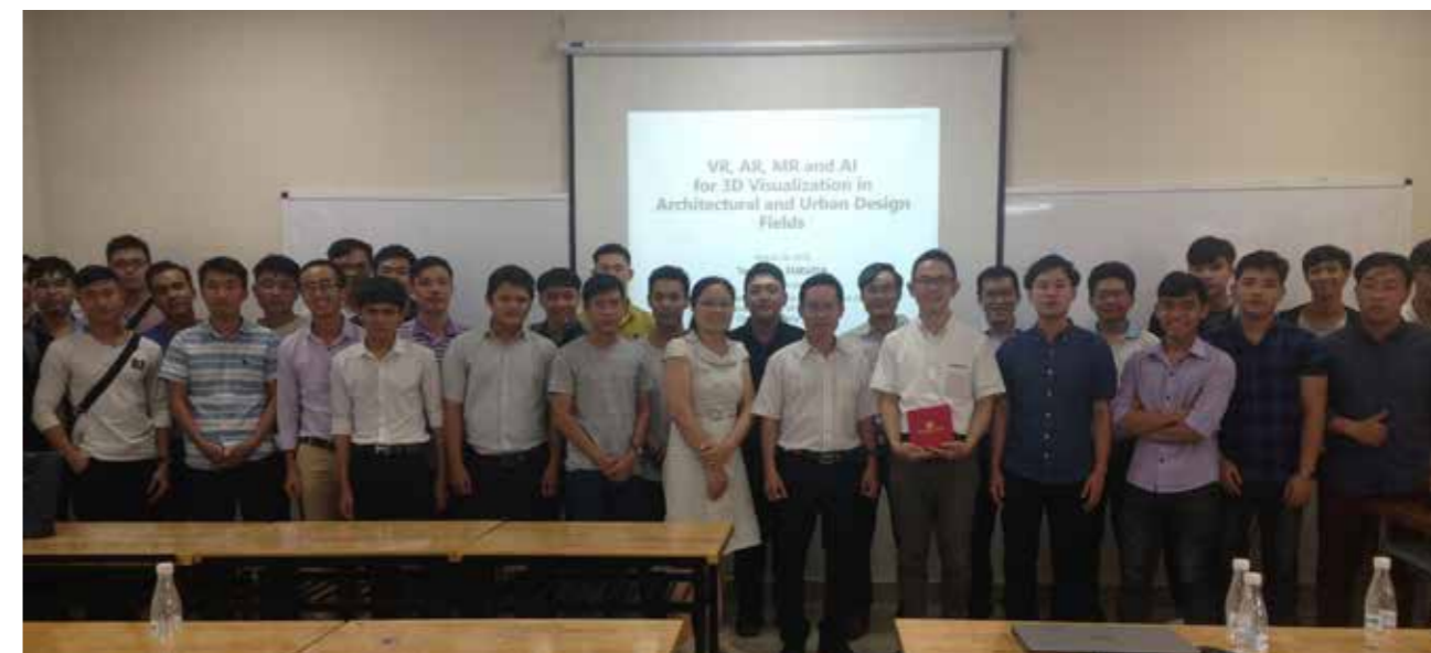
11 ホーチミン建築大学でのパブリック・レクチャー